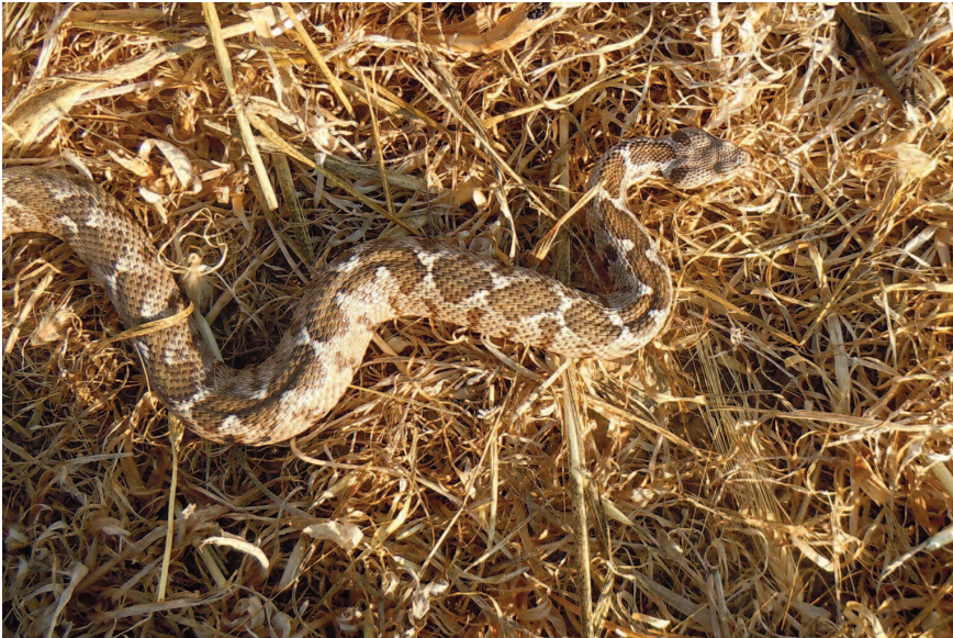
Fig. 10 — Esemplare ♀ di Montivipera xanthina dell'isola di Lipsi (Lt 63 cm) (si noti l'omocromia con il substrato).