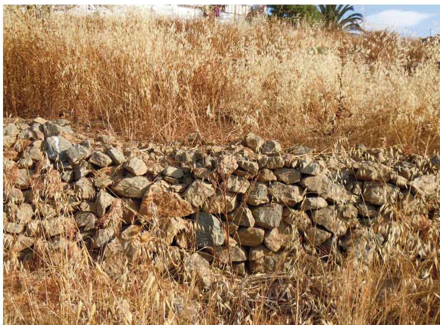
Fig. 13 — Microhabitat di Montivipera xanthina dell'isola di Lipsi.