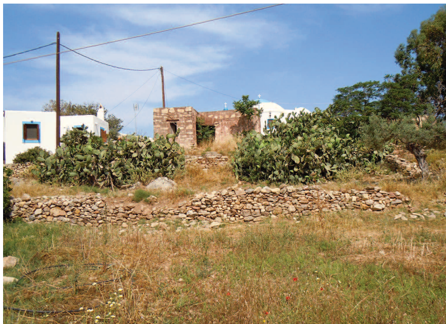
Fig. 12 — Habitat di Montivipera xanthina dell'isola di Lipsi.