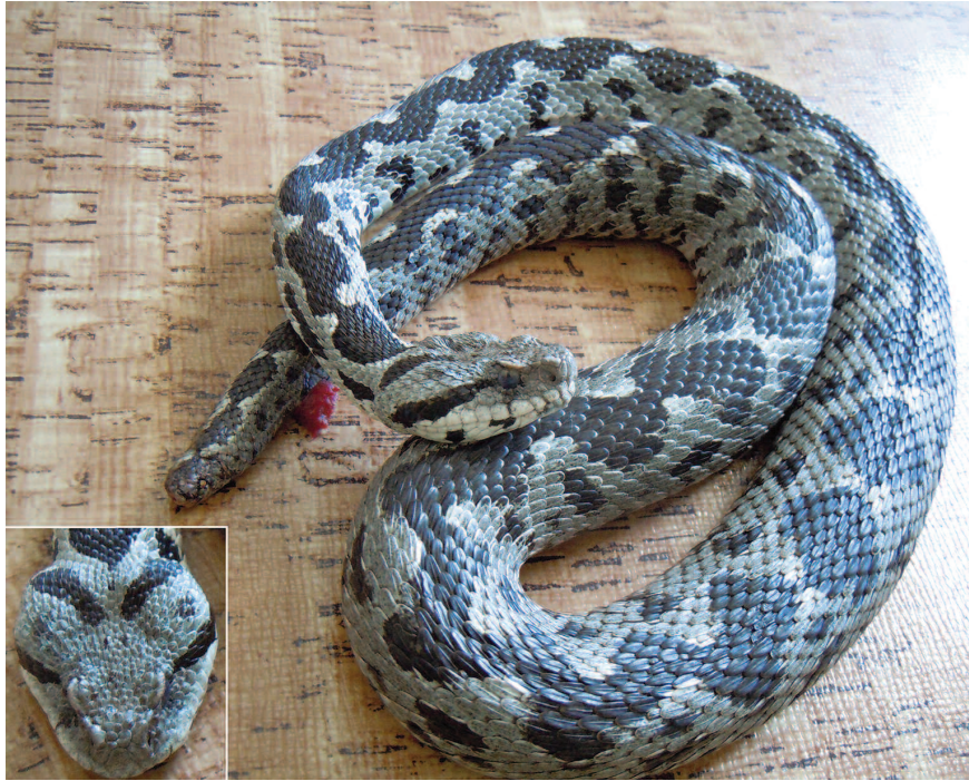
Fig. 11 — Esemplare ♂ di Montivipera xanthina dell'isola di Lipsi (Lt ca. 90 cm); nel riquadro in basso a sinistra particolare del capo (investito da motoveicolo, ma apparentemente quasi integro).

Il numero di angolosità della greca [24-29 (26)] ricorda quello della popolazione di M. xanthina della vicina isola di Leros.