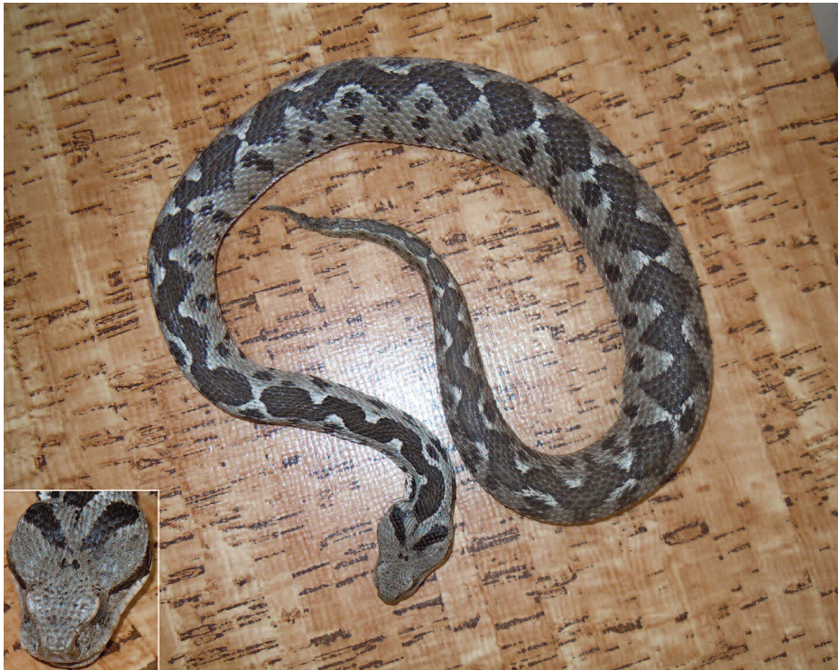
Fig. 8 — Esemplare ♂, trovato moribondo (vd. testo), di Montivipera xanthina dell'isola di Lipsi (Lt 58,5 cm) (nel riquadro in basso a sinistra si può notare meglio la particolare morfometria del capo).