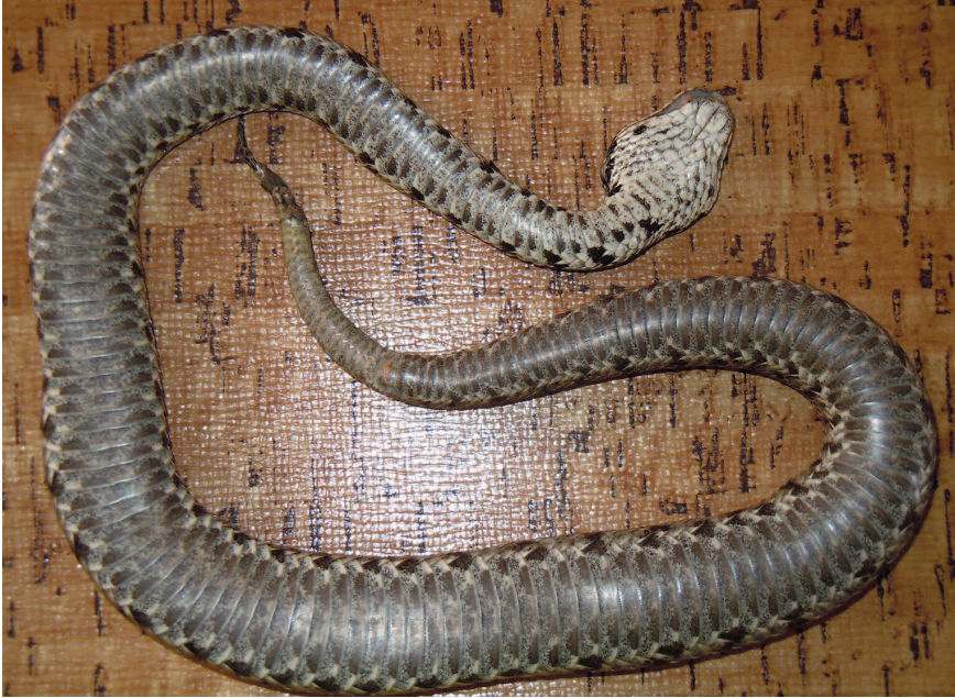
Fig. 9 — Lo stesso esemplare della Fig. 8 visto ventralmente (si noti la particolare morfologia slargata del capo e del ventre).