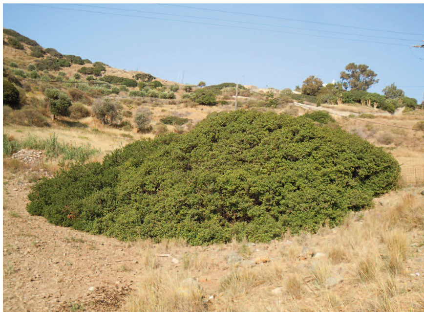
Fig. 14 — Habitat di Montivipera xanthina dell'isola di Lipsi.

mento alle particolari condizioni ambientali dell'isola. Le macchie a forma di losanga della sua ornamentazione, soprattutto quando il rettile è arrotolato, le garantiscono un'effetto somatolitico straordinario. Durante le operazioni di studio dei caratteri meristici ha mostrato comunque una reattività impressionante, simile a quella riscontrata nella sottospecie M. x. diana e della vicina isola di Leros, ma non nelle altre popolazioni studiate della specie. Emette escreti difensivi di odore simile a quelli prodotti dai rappresentanti del genere Elaphe ( s.l. ).