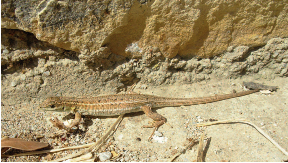
Fig. 7 — Esemplare di Ophisops elegans dell'isola di Lipsi.