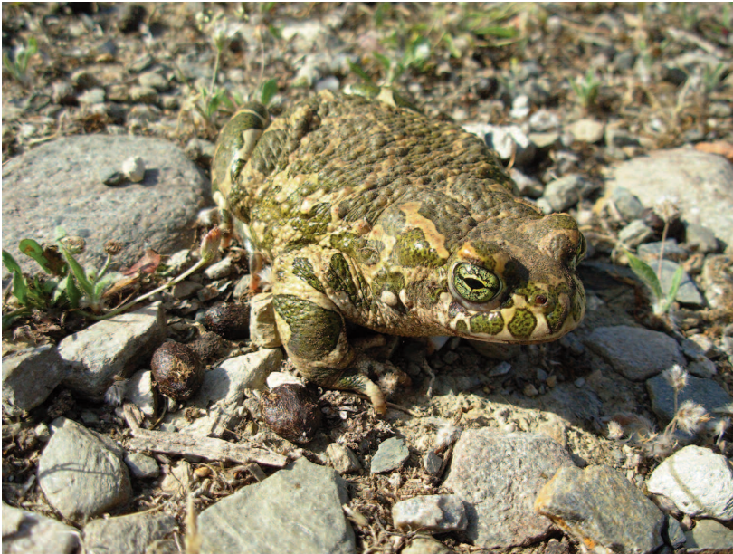
Fig. 3 — Esemplare di Bufotes viridis dell'isola di Oinousses.

Osservazioni - Due adulti sono stati trovati sotto pietre, uno sotto materiale ligneo di scarto (Fig. 3) e uno investito su strada asfaltata nei pressi dell'abitato. Le larve (a stadio precoce) si trovavano in acque sorprendentemente basse derivanti dalla percolazione attraverso un muro di recinzione nei pressi di un invaso. Il surriscaldamento di queste acque basse comunque, causando l'accelerazione dei processi di sviluppo, accelera la metamorfosi delle larve, a tutto vantaggio della specie, sia che l'acqua tenda ad evaporare sia che persista.