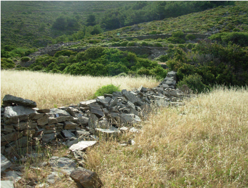
Fig. 4 — Habitat di Dolichophis caspius dell'isola di Oinousses.

Comportamento - Dolichophis caspius (localmente chiamato "laphiatis") si è rivelato straordinariamente elusivo (molto più del consueto). Forse questa eccessiva elusività potrebbe essere espressione di adattamento alla coesistenza con l'uomo nei pochi, ristretti spazi a disposizione che l'isola offre, essendo questi spazi idonei sia per la vita del serpente sia per le diverse attività agricolo-pastorali umane.