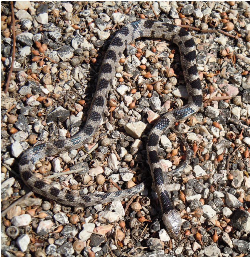
Fig. 6 — Esemplare ♂, trovato morto, di Telescopus fallax dell'isola di Oinousses (Lt 51,3 cm).

Osservazioni - Gli esemplari sono stati trovati morti al margine di una strada asfaltata che attraversava una zona molto arida, parzialmente coperta da formazione a frigana. Il primo esemplare (un giovane adulto) era stato investito e le sue condizioni non hanno consentito di poter effettuare misurazioni e/o conteggi. Il secondo invece (un ♂) appariva integro (Fig. 6), per cui è stato possibile ricavarne i seguenti dati morfometrici e meristici: lunghezza totale 51,3 cm (coda 9,1 cm); rapporto codale 4,6; 19 file di squame dorsali a metà tronco, 208 + 1/1 squame ventrali, 67/67 + 1 squame sottocaudali; presentava 34 macchie nere mediodorsali; sono stati notati acari sulla coda. Nome locale: "ochià".