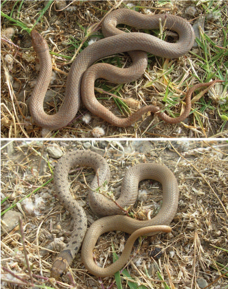
Fig. 5 — I due morfi, immacolato (sopra) e semimaculatus (sotto), di Eirenis modestus dell'isola di Oinousses.

Habitat - Quasi tutti i reperti sono stati trovati sotto pietre in zone vallive, a volte anche due esemplari sotto la stessa pietra. Solo un'esuvia fuoriusciva da un basso muretto, non lontano da una casa fatiscante.