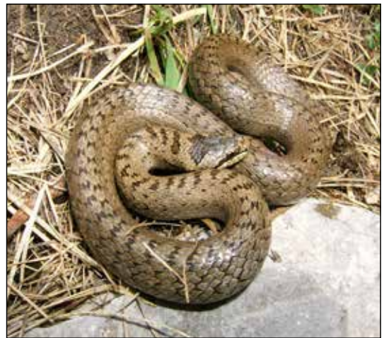
Fig. 3. Coronella austriaca , femmina, dalle cui fauci è stato estratto un maschio di lucertola di Horvath ancora vivente. Il serpente l'ha catturato in parete, poi cadendo da un'altezza di 15-20 metri (6 agosto 2016, foto L. Lapini).

L'attività del gruppo di ricerca veneto ha fra l'altro consentito di confermare la presenza della specie in una località della Val Zemola (Erto & Casso, Pordenone) segnalata da RASSATI (2010) e in altre due località della provincia di Belluno (non ancora rese note),