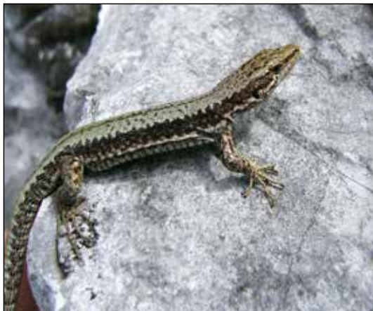
Fig. 4. Maschio di Iberolacerta horvathi predato da Coronella austriaca sulla parete della palestra di roccia del M.te Tudaio, qui ripreso dopo essere stato estratto dalla gola del serpente (6 agosto 2016, da Lapini, 2016).

dove la presenza della specie sembra essere ancora sottostimata (LAPINI, 2016; DE MARCHI ET AL., 2017).