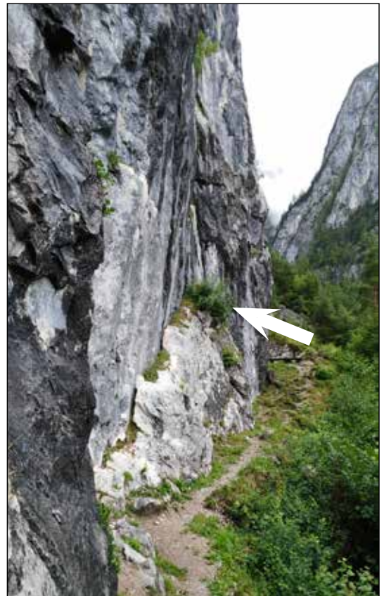
Fig. 2. La palestra di Roccia del M.te Tudaio, m 960 (Vigo di Cadore, Belluno). Habitat di Podarcis muralis , Coronella austriaca e Iberolacerta horvathi (5 agosto 2016). La freccia indica il cespuglio al quale si è aggrappato il colubro tiscio caduto dall'alto della parete.

Il giorno successivo le verifiche sono iniziate verso le ore 9.00 a. m., ma fino alle 11.30 non è stato possibile avvistare nessuna lucertola. Il pattugliamento della base della palestra di roccia è tuttavia proseguito, controllando la parte alta della parete anche con