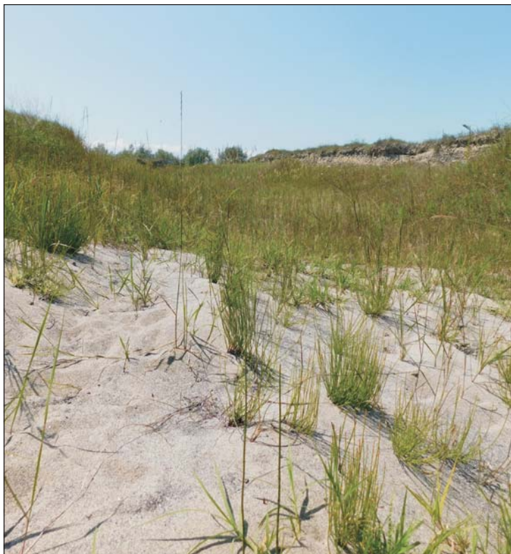
Рис. 2. Пересохшее русло р. Гедуко в урочище Гедуко (Баксанский район, Кабардино-Балкария) – биотоп Eremias arguta deserti , 9.08.2019