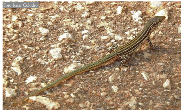
Figura 4: Juvenil de Podarcis pityusensis en el área de estudio.

varios ejemplares atropellados y se observó un cernícalo vulgar ( Falco tinnunculus ) cazando con éxito una lagartija (I. Colodro, observación personal). Aunque las observaciones realizadas sugieren que esta población no se extiende fuera del área urbana de Dénia, sería al menos recomendable realizar un seguimiento periódico como medida de precaución. Si las lagartijas estuvieran ya ocupando zonas no urbanas de la periferia, se podrían añadir a la lista de depredadores potenciales algunos ofidios ibéricos como Hemorrhhois hippocrepis y Zamenis scalaris , que actualmente están produciendo un impacto considerable sobre las poblaciones nativas de lagartija tras su introducción en Ibiza y Formentera (Torres-Oriols, 2013; Hinkley et al. , 2016).