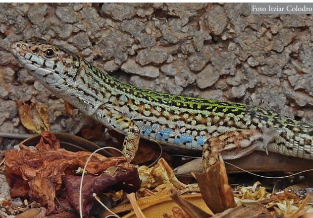
Figura 3: Macho adulto de Podarcis pityusensis presente en el puerto de Dénia.

(Figura 1), aunque es previsible que se extienda a otras zonas ajardinadas, descampados y muros del puerto, en especial las más próximas a los muelles de embarque de los ferris. Se desconoce desde cuándo están presentes en esta área, pero se han observado ejemplares de todas las clases de edad, así como interacciones reproductoras entre adultos (ver información complementaria: http://www.herpetologica.org/BAHE/videos/ms1011_podarcis_denia.mp4 ), por lo que parece que se ha establecido una población viable (Figuras 3 y 4). A diferencia de las otras poblaciones peninsulares de esta especie, que fueron introducidas por el ser humano de manera activa, todo indica que la población de Dénia se ha establecido a partir de transporte pasivo de ejemplares polizones en los ferris de la línea Dénia-Formentera.