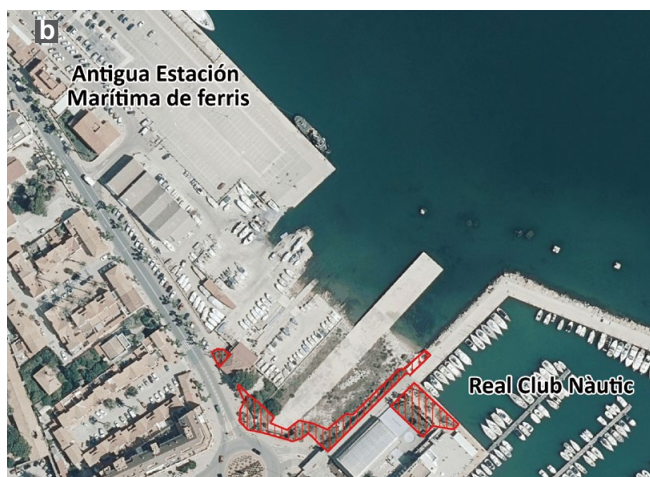
Figura 1: a) Área de distribución natural de Podarcis pityusensis (verde), poblaciones introducidas (amarillo) y localización de la nueva población peninsular (rojo). b) Área ocupada por la especie en el puerto de Dénia (trama roja).