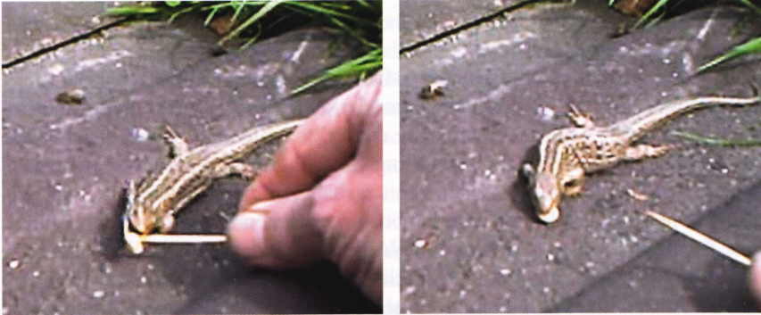
Abb.2–3: Zauneidechsen-Weibchen nimmt Drohnenmaden aus der Hand (Foto: Erhardt Löbnau, Mai 2011).

Bienen aus dem Stock geworfenen, sterbenden beziehungsweise toten Altbienen sowie auf dicke Bienenmaden und -puppen abgesehen und sie als einfach zu erbeutende Nahrung erkannt. Dieses Muster beziehungsweise diese Konditionierung haben sie bis heute beibehalten.