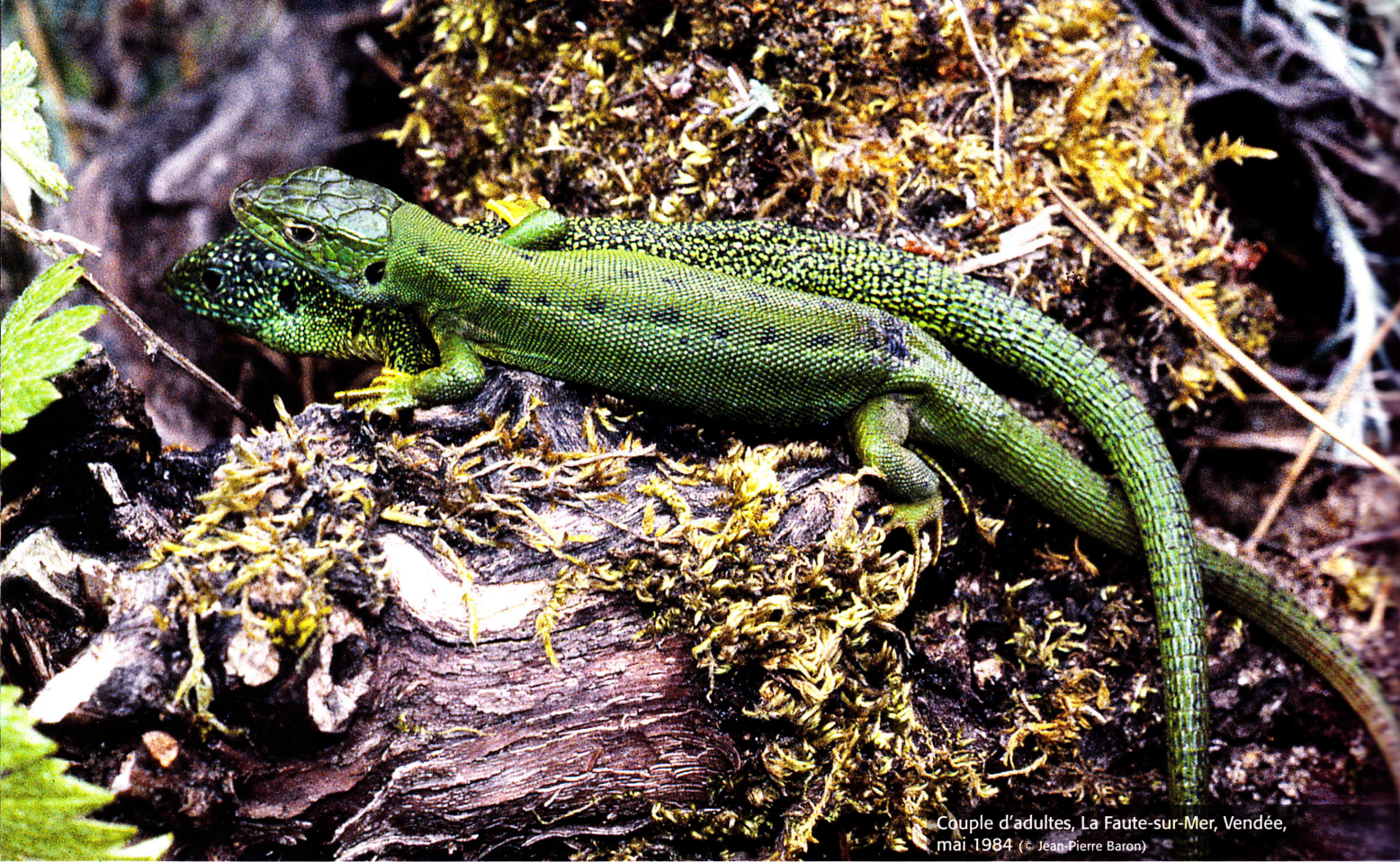
Couple d'adultes, La Faute-sur-Mer, Vendée, mai 1984