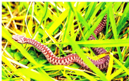
Diese junge Kreuzotter war trotz feuchten und kühlen Bedingungen im Wald unterwegs.