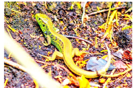
Männchen der Rotrückigen-Zauneidechse.