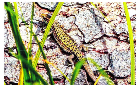
Die Waldeidechse sucht die wärmenden Sonnenstrahlen.