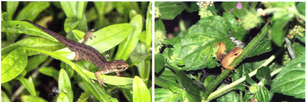
Abb. 6: Zwei kletternde Teichmolche in der Vegetation.