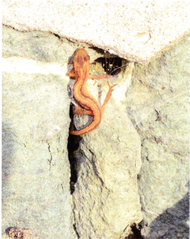
Abb. 5: Junger Teichmolch am 12.12.2015 an der Mauer.

Dass Molche gut klettern können, wird jeder wissen, der die Tiere in einem Aquarium beobachtete. Ohne Abdeckscheibe sind die Molche schnell verschwunden. Umgekehrt können Molche auch in freistehende 40 cm hohe Aquarien einwandern, wie ich