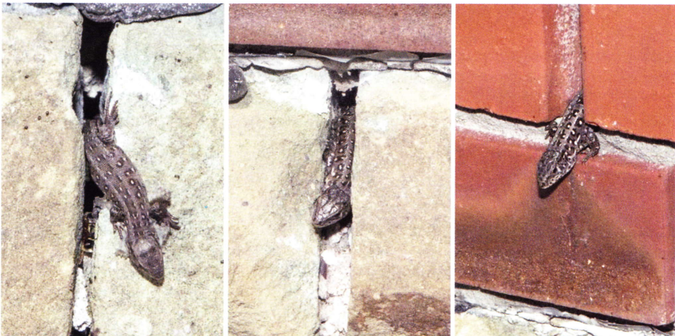
Abb. 3: Von links: Jungtier am 10.9.2007 und zwei subadulte Tiere am 27.6. und 28.7.2007.

Es war an manchen Wintertagen gut zu beobachten, wie sich einige Jungtiere bei Erwärmung der Steine in die Eingänge der Spalten legten sowie teilweise oder ganz aus den Spalten herauskrochen, um sich später wieder in diese zurückzuziehen. Das früheste Datum war der 3.2.2008, an dem ich ein Jungtier in einer der Spalten beobachten konnte.