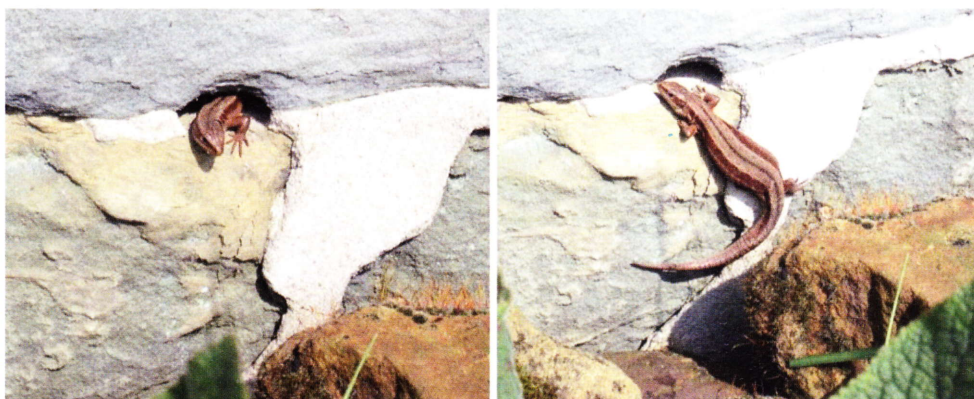
Abb. 5: Eine weibliche Waldeidechse sitzt am 10.4.2016 in und vor ihrem Versteckplatz.