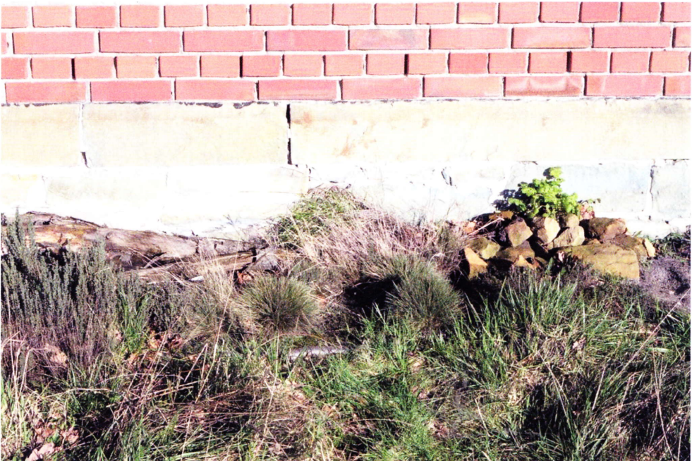
Abb. 1: Blick auf die Hauswand mit dem Sockel aus Bruchsteinen und der darüber liegenden Wand aus Ziegeln.

Abgesehen von der Überwinterung im Wasser, die bei einigen Amphibien in verschiedenen Lebensstadien und Regionen zu beobachten ist, liegen die allermeisten Überwinterungsplätze von Amphibien und Reptilien im Boden. Dabei werden bereits vorhandene Aushöhlungen (von Tieren angelegte Bauten oder andere Erdspalten) oder Auflagen (Steine, Totholz etc.) genutzt. Diese Verstecke sind überwiegend frostfrei und liegen in mäßig feuchten Lagen, wo sich keine Staunässe bildet. Bei den hier behandelten beiden Eidechsenarten sind dies oft Versteckplätze, die auch während der übr-