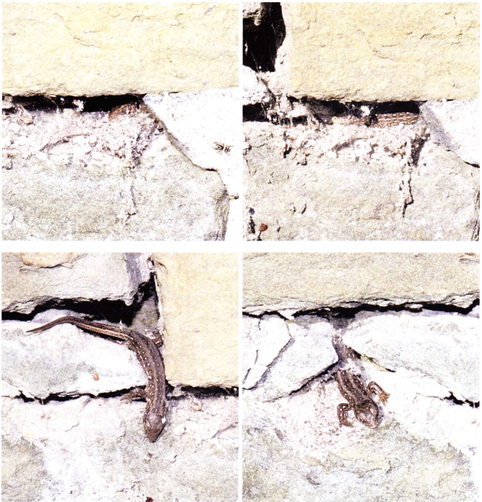
Abb. 2: Verschiedene Jungtiere der Zauneidechse am 17.2.2008 um die Mittagszeit bei sonnigem Wetter.

Meine Beobachtungen erfolgten an einem Haus im Westen Bielefelds, das durch einen ca. 50 cm hohen Sockel aus Sandsteinen mit darüber liegenden Mauern aus Ziegeln gekennzeichnet ist (Abb. 1), mit Blickwinkel Richtung Süden. Der umgebende Garten war naturnah gestaltet, mit vielen Büschen, Totholz, Steinen und zwei kleineren Folienteichen. Die zeitweilig frei im Garten lebenden Eidechsen pflanzten sich dort auch fort, denn es konnten regelmäßig Jungtiere beobachtet werden. Die beiden Gewässer lagen ca. 20–25 m von der Hauswand entfernt.