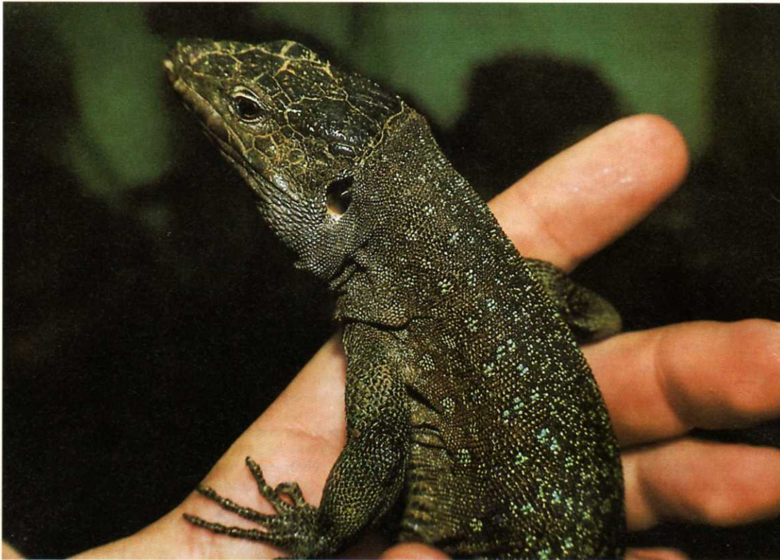
Abb. 1: Holotypus von Gallotia sp., (adultes ♂, heller Phänotyp), welcher in der Station GIEB (= Grupo de Investigaciones Etológicas Binjawack) in La Laguna lebend gehalten wird.

Bereits MERTENS (l. c.) hielt es für möglich, daß an unzugänglichen Stellen auf Teneriffa Rieseneidechsen bis in unsere Tage überlebt haben könnten. Beflügelt durch die Wiederentdeckung von G. simonyi auf El Hierro (vgl. BÖHME & BINGS 1975), trug BINGS (1980) eine Reihe von Fakten für ein mögliches Überleben von G. goliath zusammen. Der Fund großer Eidechsen, die eindeutig nicht zu G. galloti gehören, gelang im vergangenen Jahr dem Erstautor im Westen Teneriffas. Im Folgenden wollen wir diese bemerkenswerten Tiere näher vorstellen, ohne jedoch im Druck befindliche wissenschaftliche Ergebnisse vorweg zu nehmen.