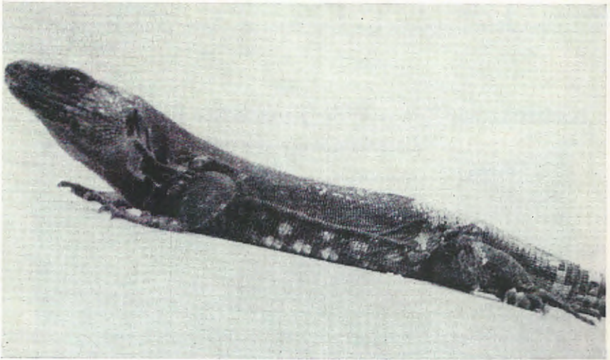
Abb. 1. Lacerta s. simonyi -♂ vom Risco de Tibataje, Hierro, mit einer Kopf-Rumpflänge von 215 mm. — Aufn. FELIPE.

Lacerta s. simonyi -♂ from the Risco de Tibataje, Hierro, with a head-body-length of 215 mm.