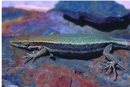
Figura 2. hembra de lagartija pallaresa.

Adultos (a partir del cuarto año calendario) con dimorfismo sexual en la coloración. Los machos tienen generalmente un abundante punteado oscuro en el dorso y píleo, que normalmente se prolonga por la parte superior de la cola. La banda lateral oscura inferior generalmente discontinua, formada por manchas. La coloración amarilla y las manchas oscuras del vientre están más desarrolladas en machos que en hembras. Los ejemplares viejos, tanto machos como hembras, están muy pigmentados. Las hembras viejas muestran más superficie amarilla, a veces algo anaranjada, que los machos viejos. Parte inferior de la cabeza y cuello de color blanco. Vientre y parte inferior de las patas de color amarillo. Parte inferior de la cola amarilla en hembras solamente (tanto más cuanto más viejas). En general, casi todos los adultos tienen el vientre con manchas oscuras. Solamente un 4,54 % de los ejemplares carece prácticamente de manchas. El 8,67% tienen manchas bien desarrolladas solamente en las dos hileras más externas, el 18,59 % en las cuatro hileras más externas, y el 68,18 % en todas las hileras de ventrales. Los adultos, (especialmente los machos) tienen líneas claras dorsolaterales estrechas, no muy diferenciadas y sobre todo en la mitad anterior del dorso (Arribas, 1999a).