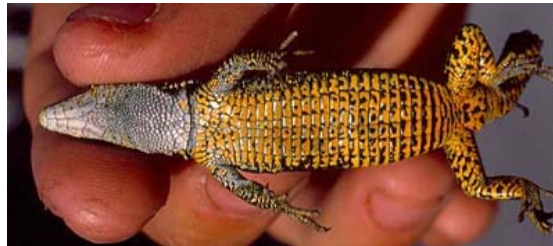
Figura 3. Aspecto ventral de la lagartija pallaresa.