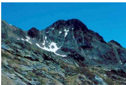
Figura 1. Hábitat de I. aurelioi en el macizo de Mont-Roig.

La lagartija pallaresa habita zonas del piso alpino desde los 2.100 m a los 2.940 m en circos glaciales con orientaciones sur, más raramente este u oeste, en localidades bien abrigadas, con pendientes moderadas y buena insolación (Arribas, 1997, 1998, 1999, 2002, 2004).