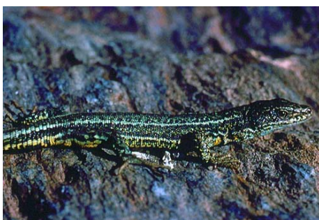
Macho de Iberolacerta aurelioi . © Oscar Arribas.