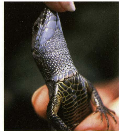
Abb. 3. Kehle und Bauchmuster des schwarzen Exemplares. – Alle Fotos: Z. KORSÓS, 1998.

Throat and belly pattern of the black individual. – All photos: Z. KORSÓS, 1998.