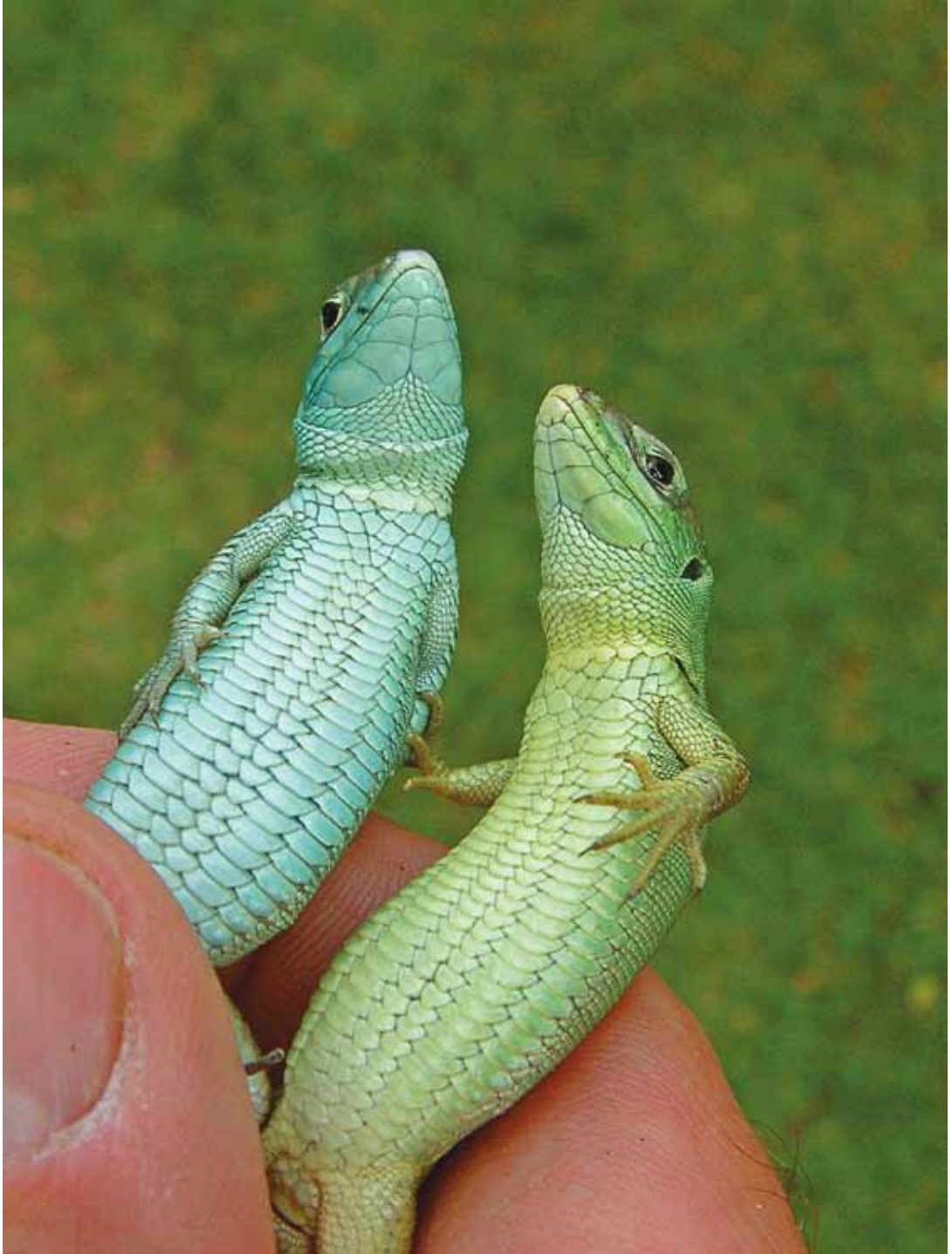
Figure 3← and 4↓. Differences in body coloration between young Western Emerald lizards that were fed with captive-bred insects (the pale blue colored animals), or fed for a few weeks with wild caught arthropods (the yellow/green colored animals).

Afbeelding 3← en 4↓. Verschil in lichaamskleur tussen jonge Westelijke smaragdhagedissen die gevoerd worden met gekweekte insecten (de flets-blauw gekleurde dieren), of enkele weken met weideplankton (de geel/groen gekleurde dieren).