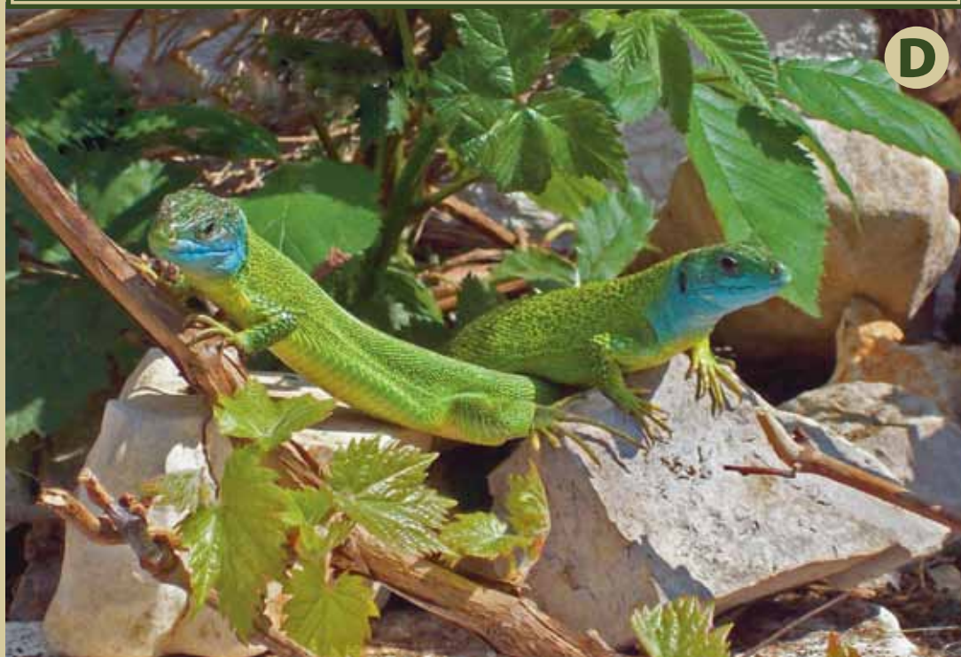
Figure 2. In general, there is a large difference in body coloration between captive bred lizards and animals in the wild. Captive bred Spanish Emerald lizards ( Lacerta schreiberi , A) and Western Emerald lizards ( Lacerta bilineata , C) have abnormal pale blue/green backs and white bellies. In the wild these lizards display striking green backs and intense yellow ventral sides ( Lacerta schreiberi , B; Lacerta bilineata , D).