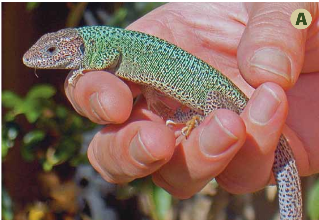
Afbeelding 2. Er is meestal een groot verschil in lichaamskleur tussen nakweek hagedissen en dieren in het wild. In gevangenschap opgegroeide Spaanse smaragdhagedissen ( Lacerta schreiberi , A) en Westelijke smaragdhagedissen ( Lacerta bilineata , C) hebben flets blauw/groene ruggen en een witte buik. In het wild hebben deze hagedissen prachtig groen gekleurde ruggen en een citroengele buikzijde ( Lacerta schreiberi , B; Lacerta bilineata , D).