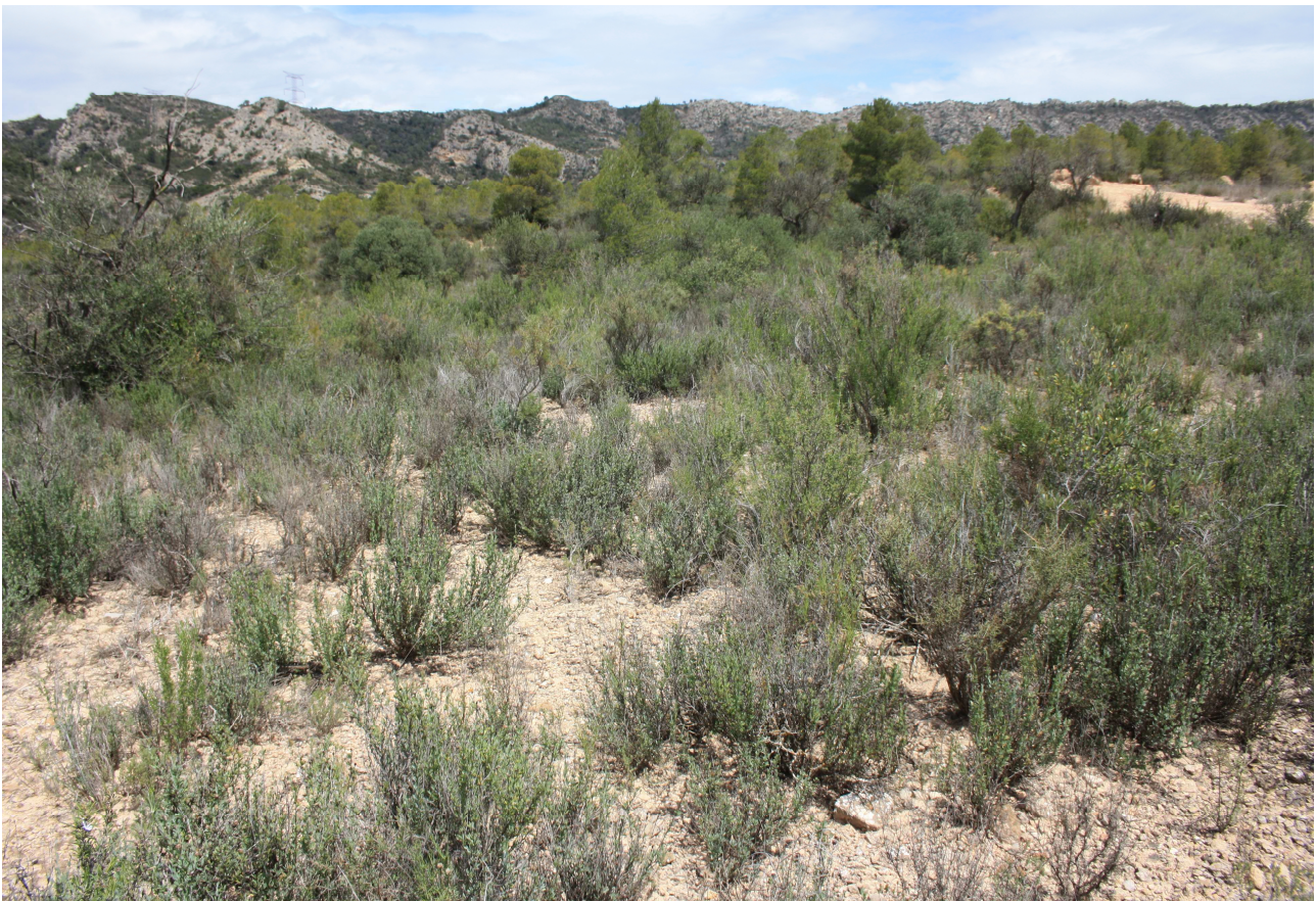
Figura 2. Habitat de retalls de bosc de pi blanc amb brolla i timoneda on domina el romaní i la foixarda ( Globularia alypum ) a Garcia (Ribera d'Ebre).