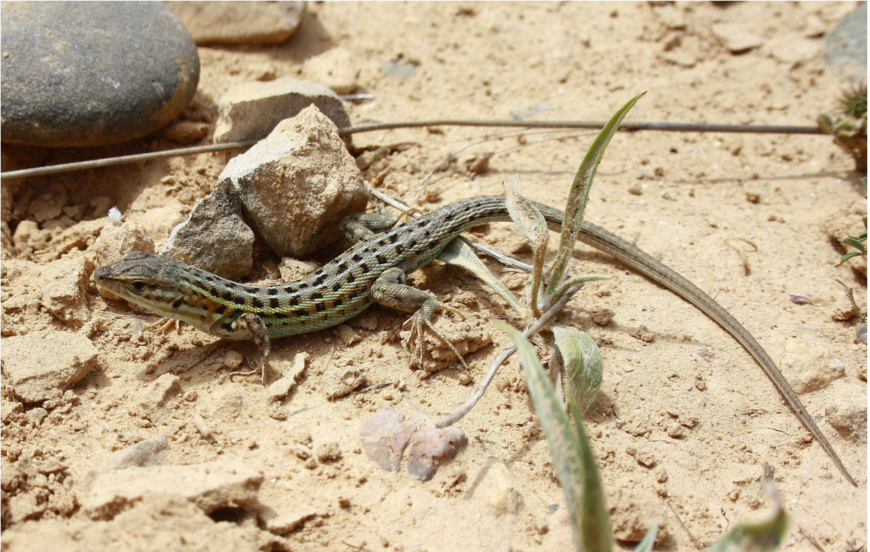
Figura 3. Exemplar adult de Psammodromus edwardsianus de Riba-roja d'Ebre (Ribera d'Ebre).