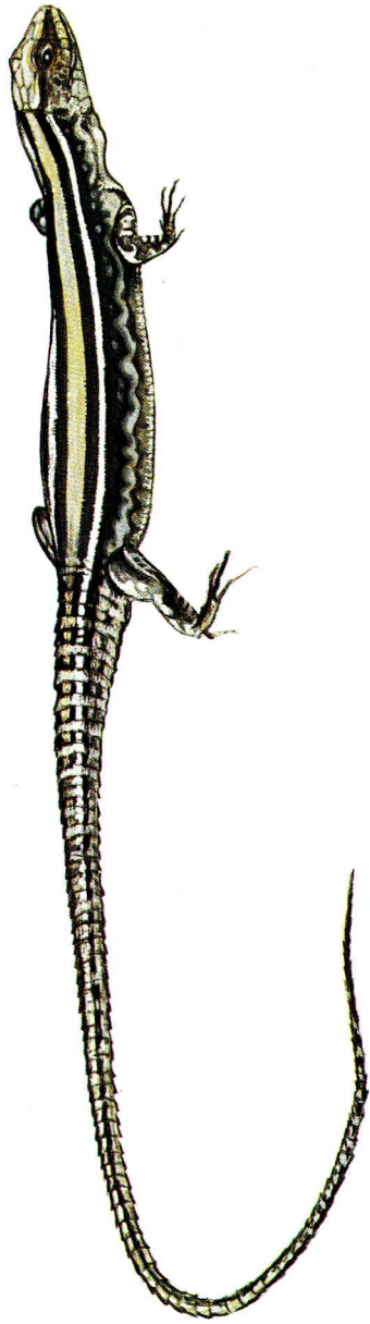
Lagartija ibérica ( Lacerta hispanica )