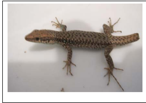
شکل ۱- نمایی از سطح پشتی گونه Darevskia chlorogaster

مطالعه مبهم به نظر می‌رسید [۱۲]. و قبلاً پرفسور اندرسون و دکتر رستگار پویانی در مرز بین استان های گیلان و اردبیل احتمال حضور این گونه داده‌اند، اما در این تحقیق نمونه‌هایی از قسمت‌های غربی استان نیز صید گردید و برای اولین بار از استان اردبیل گزارش می‌شود. این گونه شباهت زیادی به Iranolacerta brandtii brandtii سوسمار ایرانی برانت دارد و در آغاز در محل نمونه‌گیری این گونه سوسمار ایرانی برانت تشخیص داده شد اما بر اساس ویژگی‌های مورفولوژیک، مورفومتریکی و مریستیک معلوم گردید که ۴ نمونه‌ی جمع‌آوری شده، مربوط به گونه‌ی لاسرتای شکم‌سبز ( Darevskia chlorogaster ) می‌باشد. مهمترین تفاوت‌های بارز و مشخص در این دو گونه عبارتند از: اختلاف در نوع فلس‌های سطح پشتی، تعداد فلس‌های سطح شکمی، و تعداد فلس‌های عقب بینی. به طوری که در سوسمار ایرانی برانت سطح فلس‌های سطح پشتی صاف و یا بدون تیغه است، و این در حالی است که لاسرتای شکم سبز دارای فلس‌های تیغه‌دار در پشت بدن خود می باشد. تعداد فلس‌های سطح شکمی لاسرتای شکم سبز ۶ عدد است، اما در سوسمار ایرانی