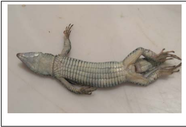
شکل ۲- نمایی از سطح شکمی گونه Darevskia chlorogaster