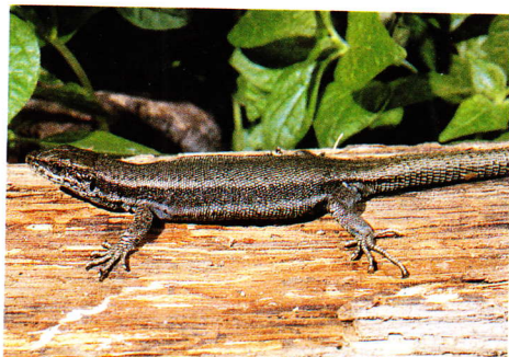
Hembra de lagartija pirenaica (Ordesa, Huesca).

Lagartija aplanada, con longitud cabeza-cuerpo no superior a los 62 mm. Dorso grisáceo, verdoso o pardo claro, generalmente sin líneas en su parte central. Costados pardos uniformes o con pequeñas manchas más claras, y con una línea blancuzca, de contornos poco definidos que recorre longitudinalmente el centro de los costados. Zona ventral blancuzca, amarillenta o verdosa.