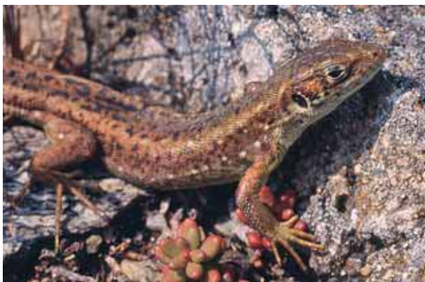
Nationalpark Thayatal, Tschechien