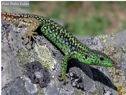
Figura 3. Macho adulto de I. galani de Pena Trevinca, A Veiga, Ourense. Obsérvense los característicos ocelos azules en los flancos de los machos de esta especie.

muros de las construcciones humanas, donde alcanza densidades relativamente elevadas. Otras poblaciones de estas sierras también ocupan muros de construcciones aisladas, pero ésta es la única asociada a un núcleo de población humana habitado de cierta entidad.