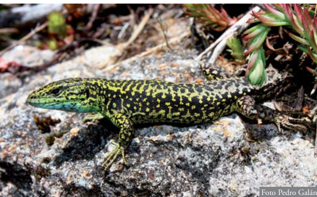
Figura 2. Macho adulto de I. monticola de la población aislada del puente de A Previsa, Chandrexa de Queixa, Ourense. Este ejemplar tenía la zona ventral de color azul y carecía de ocelos de este color en los flancos.

En su conjunto, estas poblaciones se encuentran aisladas de las más próximas de su especie, situadas a 37-39 km en línea recta, en los montes de O Incio y la Serra do Courel (Lugo) y separadas por el cañón del río Sil, que delimita una zona de clima y vegetación marcadamente mediterráneas.